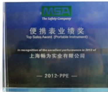
梅思安2012便携表业绩奖