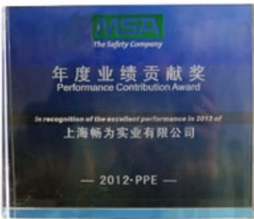
梅思安2012年度业绩贡献奖