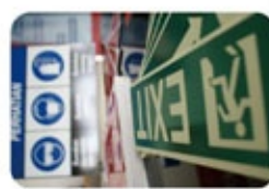
国家标准安全标识