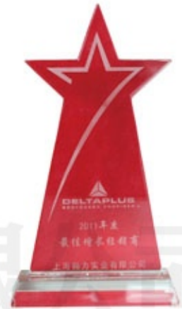
代尔塔2011最佳增长经销商奖