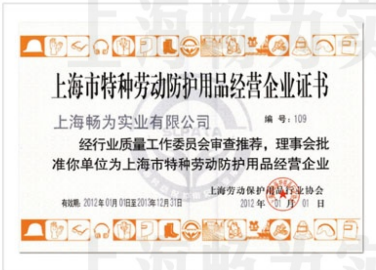
上海市特种劳动防护用品经营企业证书