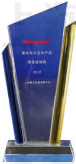
霍尼韦尔2012最佳经销商