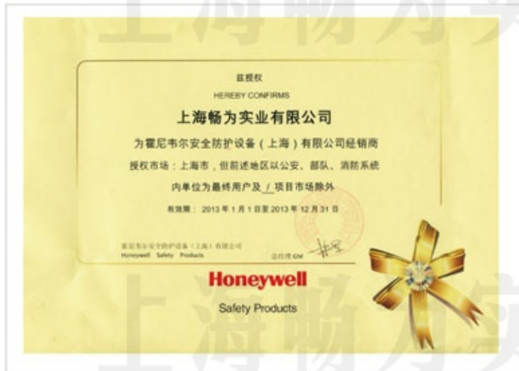
霍尼韦尔代理证书