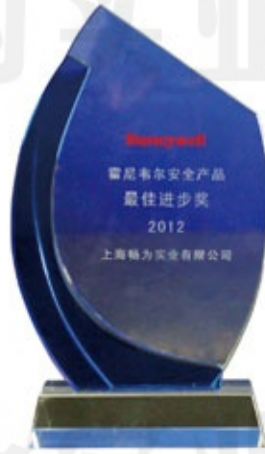
霍尼韦尔2012最佳进步奖