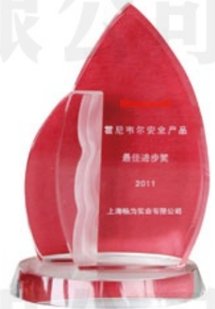
霍尼韦尔2011最佳进步奖