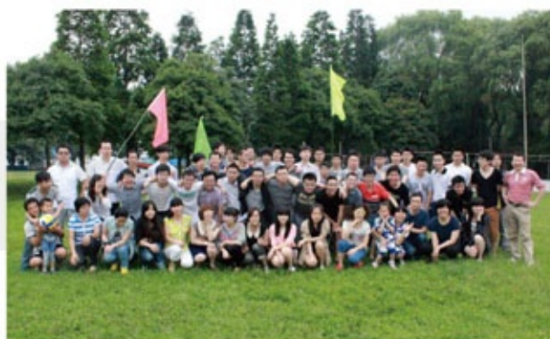
员工户外集体活动