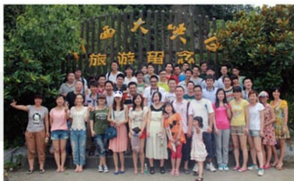
浙西大峡谷旅游留念