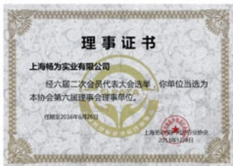
上海劳动保护用品行业协会理事证书