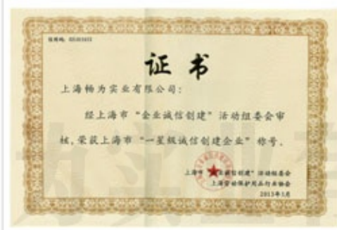
一星级诚信创建企业