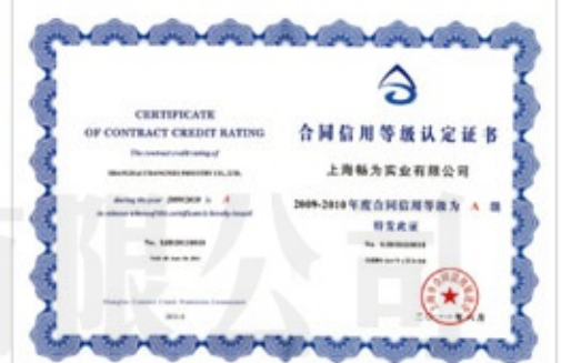
合同信用等级A级认定证书