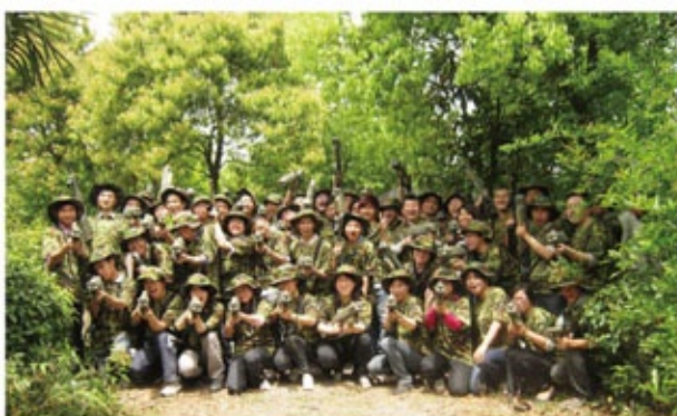
员工户外集体活动