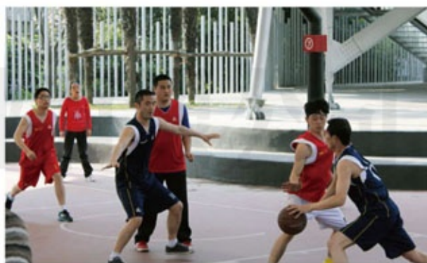
与霍尼韦尔篮球赛