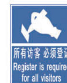
编号: FKBZ-015 名称: 所有访客必须登记牌