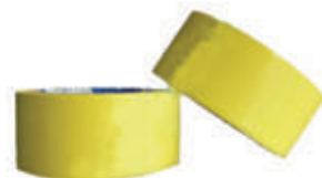
编号: HXJD-001 名称: 划线胶带(黄色 4.8cm)