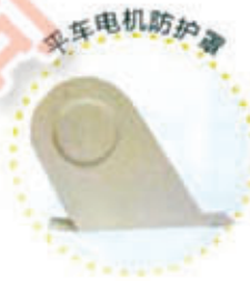
编号: G4A49A0173951 名称: 平车皮带轮防护罩