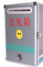
编号: TSX-001 名称: 意见箱, 投诉箱