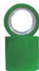
编号: HXJD-002 名称: 划线胶带(绿宽 10cm)