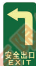
编号: DT006 名称: PET 耐磨地贴 规格: 150mm*300mm*1mm