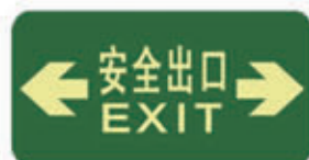
编号: DT008 名称: PET 耐磨地贴 规格: 150mm*300mm*1mm