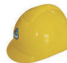
编号: TBFH-003 名称: 安全帽