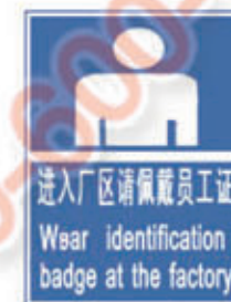
编号: FKBZ-014 名称: 进入厂区请佩戴员工证标牌