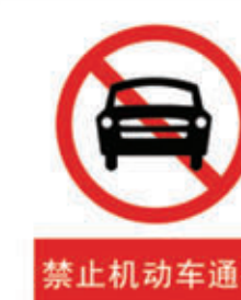
编号: JTJL-004 名称: 禁止机动车通行牌