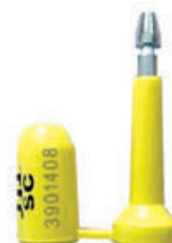
编号: AQSJ-004 名称: 高保封条集装箱封条