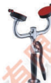
编号: CW-0355A 名称: 台式移动双口洗眼器