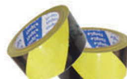
编号: JSJD-002 名称: 警示胶带(黄黑 4.8cm)