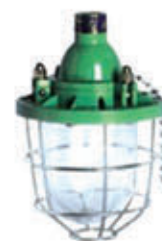
编号: FBD-001 名称: 厂用防爆灯(100W)