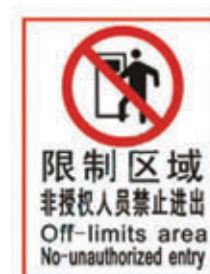
编号: FKBZ-013 名称: 限制区域非授权人员禁止进出牌