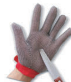
编号: SBFH-001-1 名称: 进口五指钢丝手套

订购咨询热线: 021-51029651 传真: 021-61111634 手机: 13816072916 (黄小姐)