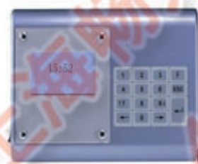
编号: TW-200 名称: 考勤机