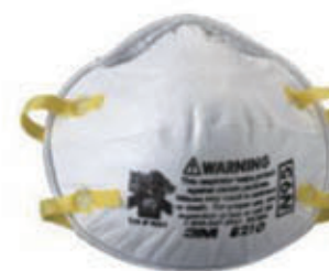
编号: KBFH-006 名称: N95 活性炭口罩