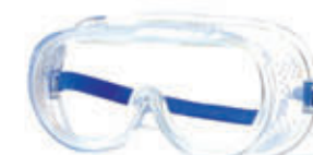
编号: YBFH-007 名称: 化学安全防护眼镜