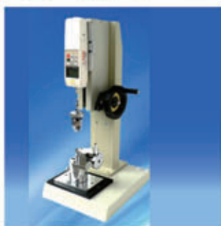
编号: CW-004 名称: 钮扣测试仪