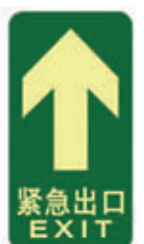
编号: DT001 名称: PET 耐磨地贴 规格: 150mm*300mm*1mm