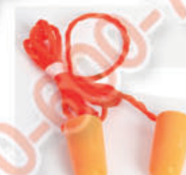
编号: RBFH-002 名称: 3M 带线耳塞