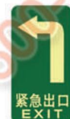
编号: DT002 名称: PET 耐磨地贴 规格: 150mm*300mm*1mm