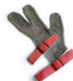
编号: SBFH-004 名称: 进口五指钢丝手套