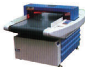
编号: SG-338 名称: 验针机