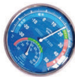
编号: WDJ-003 名称: 干湿温度计