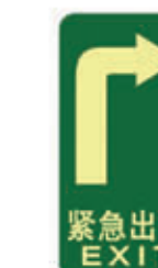
编号: DT003 名称: PET 耐磨地贴 规格: 150mm*300mm*1mm