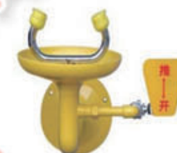
编号: CW-0759C 接墙式 名称: 不锈钢紧急洗眼器