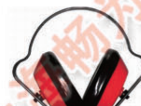
编号: RBFH-003 名称: 隔音耳罩