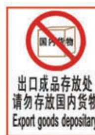
编号: FKBZ-018 名称: 出口成品存放处请勿存放国内货物牌