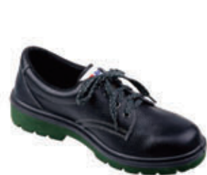
编号: JBFH-002 名称: 安全防护鞋