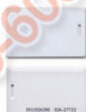
编号: ID0045 名称: 电子 ID 考勤卡