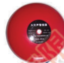
编号: XFJL-002 名称: 消防警铃