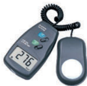
编号: JCY-003 名称: 光度计