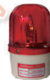
编号: BJQ-003 名称: 声光报警器