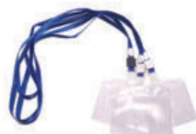
编号: DSKT-010 名称: PVC 证件卡套 / 绳