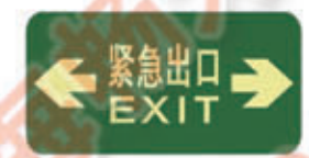
编号: DT004 名称: PET 耐磨地贴 规格: 150mm*300mm*1mm