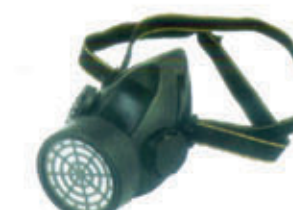
编号: KBFH-010 名称: 单罐防毒口罩