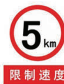
编号: FKBZ-002 名称: 限制速度牌