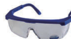
编号: BN-0234792F 名称: 防冲击眼镜