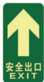
编号: DT005 名称: PET 耐磨地贴 规格: 150mm*300mm*1mm