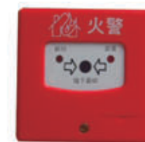
编号: XFJL-001 名称: 手动火灾报警按钮