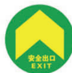
编号: QT-002 名称: PVC 墙贴 规格: 195mm*195mm*1mm