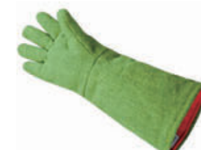
编号: BN-C4632575 名称: 耐高温手套