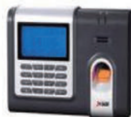
编号: TW-100 名称: 指纹考勤机