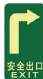
编号: DT007 名称: PET 耐磨地贴 规格: 150mm*300mm*1mm