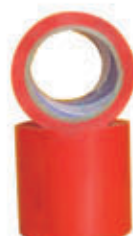
编号: JSJD-003 名称: 警示胶带(红宽 10cm)