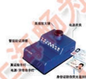
编号: JBY-001 名称: 二代身份证鉴别仪(刷卡式)