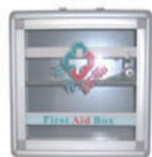
编号: JJYX-001/002/003 名称: 手提式 / 壁挂急救药箱