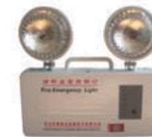
编号: YJD-001 名称: 双头消防应急灯