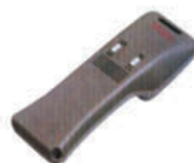
编号: SG-238 名称: 台式检针机